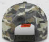
Back / Dos