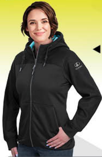
Ladies Trail Hybrid Jacket KB01-4230 | S-2XL