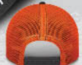
Back / Dos