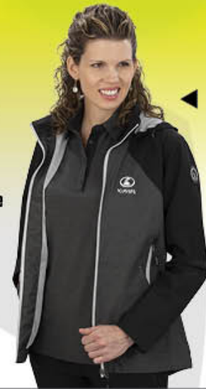
Ladies Rev'd Up Jacket KB01-3909 | S-2XL