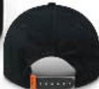
Back / Dos