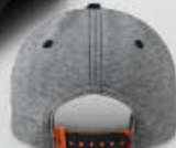
Back / Dos