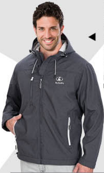
Men's Endurance Jacket KB01-3863 | S-3XL