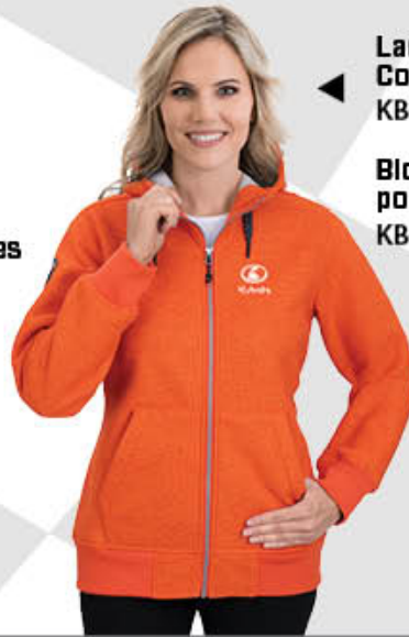
Ladies Trail Country Jacket KB01-4136 | S-2XL