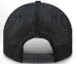
Back / Dos